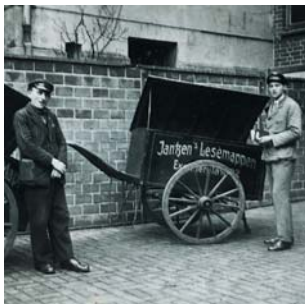
Jantzens Zusteller damals